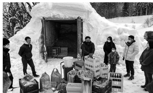
雪室と貯蔵商品の野菜などを見学

物コンテナを雪で覆ってつくった雪室を見学し、貯蔵されている野菜や果物などの試食を行ったほか、雪中貯蔵の日本酒とフルーツでのカクテルづくり、雪を使ったアイスクリーム体験、スノートレッキングなども楽しんだ。雪室内部は気温 0 度、湿度 90% に保たれるため長期保存ができ、野菜などの甘みが