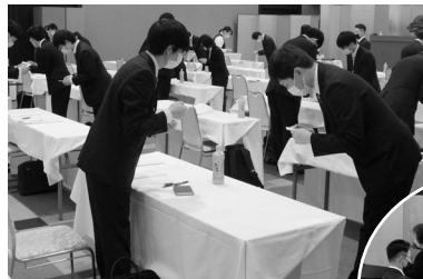
名刺交換や接待マナー等の演習に取り組む参加者

第一部の歓迎式典では、当所和賀会頭より「様々な選択肢があった中、ここ湯沢雄勝の地に就職していただき本当に嬉しい。社会人とは学生と何が違うのか今日のセミナーから一つ