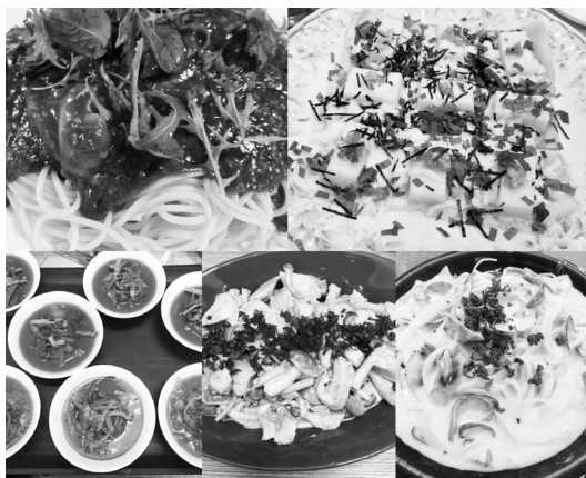
バラエティーに富んだ料理を提供します

店名のフィオーレはイタリア語で「花」。大変な時期だからこそ、懸命に頑張っている皆様の日常にひとときのやすらぎと彩りの花を添えさせていただけますように、スタッフ一同心よりご来店お待ち申し上げております。