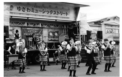
迫力ある演奏で観客を魅了 ※写真は全て一昨年の様子