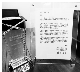
野田聖子内閣府特命担当大臣からの感謝状と記念のクリスタルトロフィー