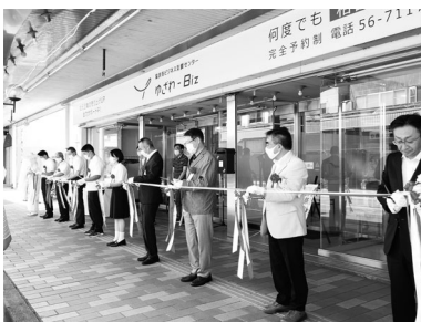
開会式で行われた テープカット