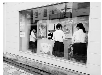
展示会の準備作業をする高校生 ※写真は全て一昨年の様子