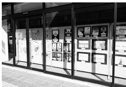
商店街店舗のショーウィンドウに 展示された作品