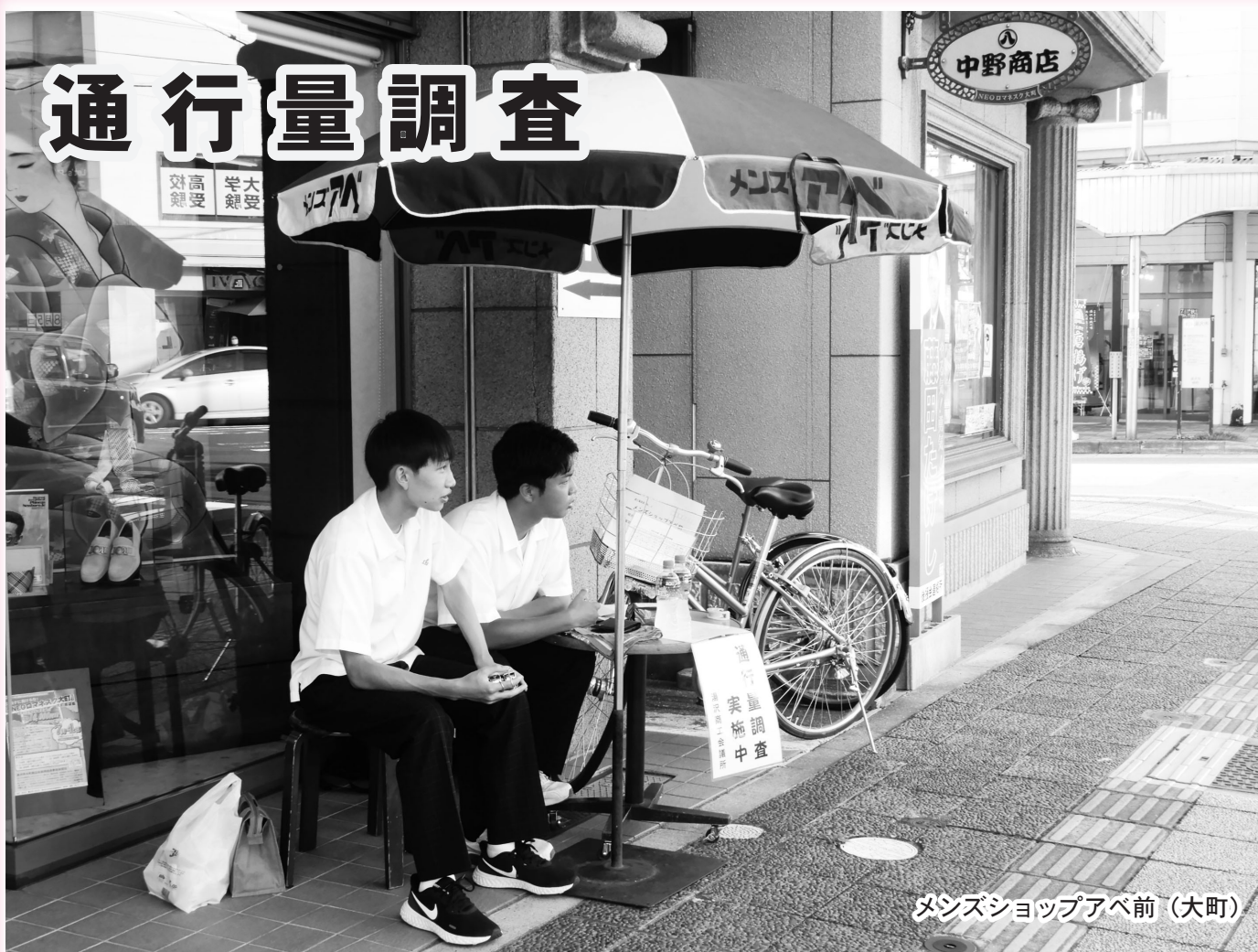
メンズショップアベ前（大町）

7月29日（金）、31日（日）に通行量調査が行われ、猛暑の中、調査員28名が市内14ヵ所の車両や歩行者の流れを調査しました。