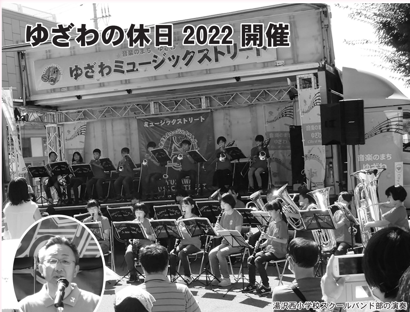
湯沢西小学校スクールバンド部の演奏