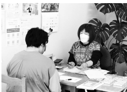
パワーストーンや誕生日に秘められた謎について解説 (ピュアハウス湯沢支店)