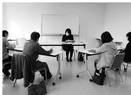
将来を見据えた資産運用の大切さを学びました (株秋田銀行湯沢支店)