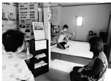
腰痛予防の健康体操を実践！模型を使った説明でさらに理解を深めました (コスモス自然形体院)