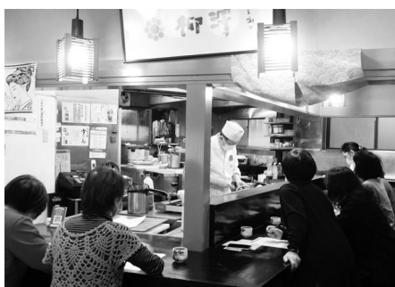
参加者とコミュニケーションをとりながら天ぷらのコツを伝授！ (弁当・懷石の店 柳澤)