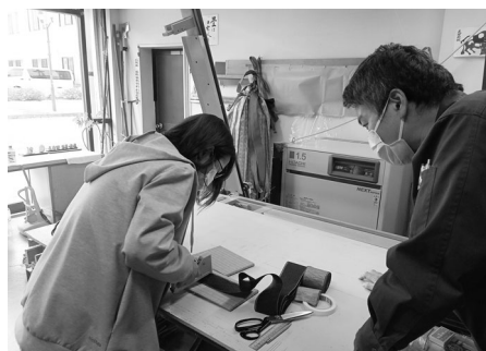
ミニ畳作りに挑戦！専用の工具を使い丁寧に作業しました (小田原畳本店)