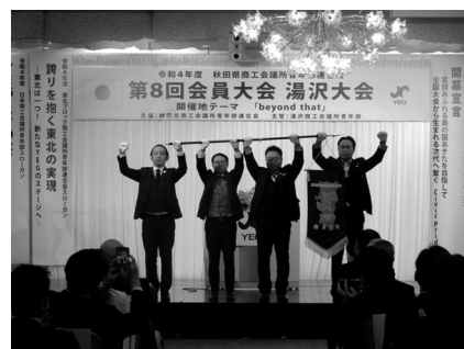
大会旗が次年度へ引き継がれました

記念式典の最後には、大会旗伝達式が行われ、湯沢から次年度開催地の秋田へ大会旗が引き継がれました。