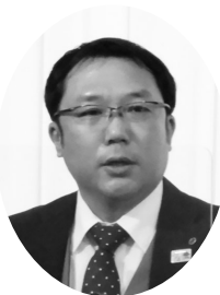
挨拶する 飯塚県連会長

参加いただいた皆様を感じていただき、有意義な会員大会にしたい」と挨拶がありました。