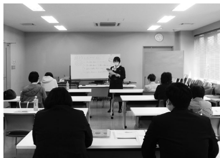
「もしも…」の時に備えて体験談を交えた講話に参加者も興味津々の様子でした (株北都銀行湯沢支店)