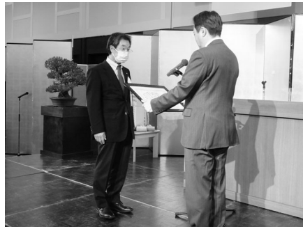
受賞者へそれぞれ感謝状が贈呈されました

当所の新年祝賀会が1月13日（金）湯沢グランドホテルで開催され、会員ら約170名が参加し盛大に新年を祝いました。