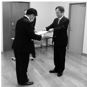
和賀会頭から辞令が交付されました