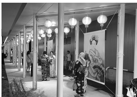
台湾ランタンフェスティバルにて実際に展示されているランタン100基を展示。幻想的な空間に包まれていました。