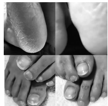
Before → After