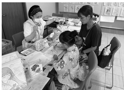
ミニ絵どうろう絵付け体験。参加者にとって思い出の作品となりました。