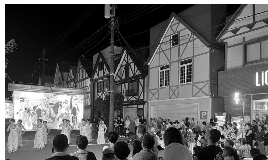
中央通り商店街ではフラダンス(メレアロハ)が行われたほか、各イベント会場には大勢の人々で賑わいました。