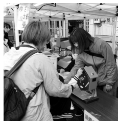
ドキドキ・ワクワクの大抽選会♪