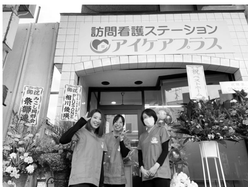
スタッフ一同日々研鑽し、 皆様を全力でサポート

30代の若い力で湯沢を明るく、笑顔あふれる地域づくりに貢献できるよう日々頑張っていきますのでよろしくお願いします。