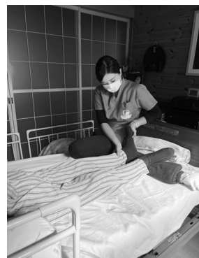
看護サービスの様子