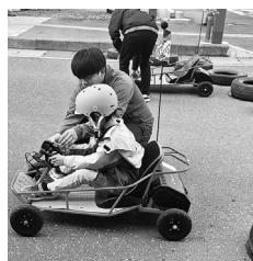
ゴーカートに興味深々!