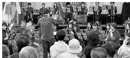
NG吹奏楽団員らが子ども達に負けない演奏を披露