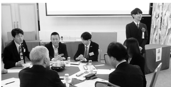
5 1 名のなるテック社員が講演会に参加し、会員らと意見交換

明確化、文化形成によって社内基準を上げることが非常に大事となります。基準が低い社員が居心地の良い会社ではなく、基準が高い社員が居心地の良い会社をつくることで質の良いサービス提供に繋がります。東成瀬村はIT産業の村だと言われるようひとつひとつ目の前の壁をクリアして地方創生の成功事例として日本の未来を豊かにしていくために、なるテックは挑戦していきます」と述べました。