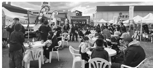
たくさんの来場者で会場は大賑わい