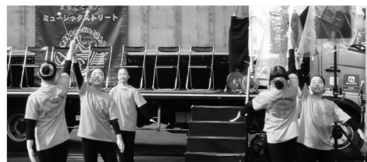
息の合ったバトンの交換で華麗な演技を披露