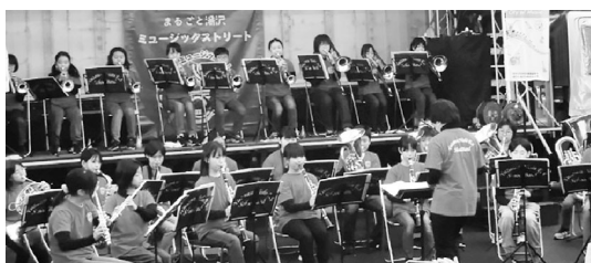
小学生が奏でる音色で観客を魅了

商店街のイベントとして定着したゆざわの休日には、子どもから大人まで幅広い世代の方々が会場にきて楽しんでいただき、盛会裡に終わることができました。