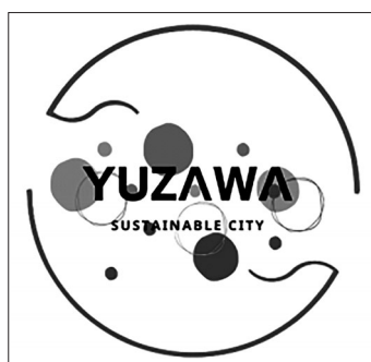
（左）湯沢市産杉の未利用材・林地残材を利活用したコースター （当日参加された方へ配布されました）