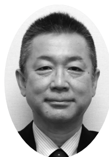
サービス業部会長