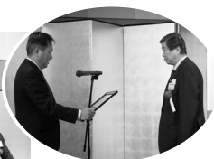
表彰状を 受領する 者

開会に先立ち、能登半島地震の犠牲者に対し黙とうが捧げられました。その後の表彰式では、当地域経済の発展に寄与された役員・議員2名、会員企業従業員10名（下記参照）に和賀会頭から表彰状と記念品が贈呈されました。