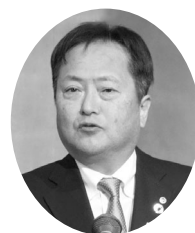
和賀会頭 を述べる 抱負

祝賀懇親会で和賀会頭は「昨年は新型コロナウイルスが5類に移行されたことから様々なイベントを通常通り開催することが出来ました。なかでも台湾からの誘客、インバウンド招致の事業を展開し、7月の『夏季旅行展』、12月には『東北遊楽日』と二度にわたり台湾を訪問し、湯沢市、（一社）湯沢市観光物産協会と協力して観光PRブースを出展し大盛況に終わることが出来ました。また、横堀道路が令和6年後半の供用開始に向け順調に推移しており、新庄金山道路も同時期の開通とのことから山形東京が一気に近くなり物流面・観光面でも大きな経済効果が期待されます。地元如若者を定着させるためにも我々地方の中小企業もコロナが収束した今だからこそ可能な限り応えなければならぬと考えています。商工会議所はこうした事業者への相談・支援をワンストップ