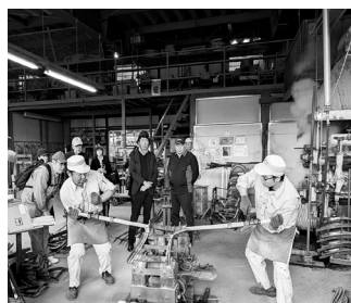
秋田木工株式会社 伝統の技を見学