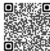
高年齢者活躍企業 コンテスト

https://www.jeed.go.jp/elderly/activity/activity02.html